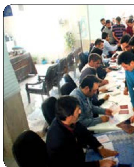
امسال همزمان با انتخابات ریاست جمهوری، انتخابات شوراهای اسلامی شهر و روستا نیز برگزار شد. آنچه از صف ها مشاهده می شد این بود که مردم با برنامه ریزی و در دست داشتن لیست های انتخاباتی خود که از پیش تهیه کرده بودند به پای صندوق های رای آمدند. بعضی از شهروندان حتی قبل از باز شدن درهای محل رای گیری منتظر بودند تا در این مشارکت سیاسی پیشقدم باشند. بانوی میانسالی که به یکی از حوزه های انتخاباتی بلوار جمهوری اسلامی آمده بود به همکار ما چنین گفت: از قدیم رسم بر این بوده که در انجام تکلیف شرعی کوتاهی و تعللی نباید صورت بگیرد. برای لیبیک به رهبر و برای سرکوب دشمنان امروز ایران به همراه فرزندان و نوه هایم در پای صندوق رای حاضر شده ام. وی که خود را مادر شهید معرفی کرد در ادامه چنین گفت: پس از برجام و چندین شهید شیرینی پیروزی، اکنون وقت همدلی و همزبانی برای کسب پیروزی های بعدی است.

وظیفه در لحظه ای که گفتگو با این مادر شهید انجام می شد هر لحظه حضور مردم بیشتر می شد و فضای انتخاباتی پر شورتر و پر رونق تر شد. زن جوانی که به همراه فرزند سه ساله اش به یک مسجد آمده بود، چنین گفت: همانگونه که مادرم مرا از ابتدای انقلاب به مسجد می آورد تا فضای شور و شمع انتخاباتی را از نزدیک ببینم و لمس کنم من نیز وظیفه دارم دست فرزندم را بگیرم و با خود به این عرصه بیاورم تا این لحظات برای همیشه در ذهن وی ثبت و محفوظ شود. در خانه نشستن و نیامدن برای رای دادن در این امر سیاسی کاری ناپسند و نارواست و ظلمی در حق خودمان است. به طور حتم با همدلی و انتخاب فردی اصلاح، باعث ایجاد آرامش سیاسی، رفاه اجتماعی و گشایش اقتصادی در جامعه خواهیم شد