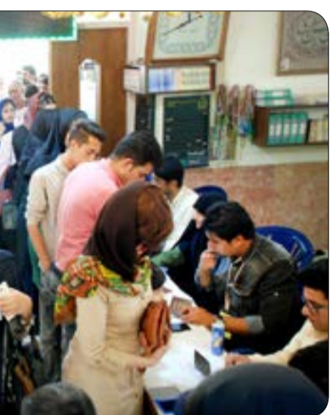
روز گذشته، روز دوربین های عکاسان و تصویر برداران و خبرنگاران رسانه های داخلی، خارجی، شنیداری و مکتوب بود. خبرنگاران این رسانه ها با پای مردم در شعب اخذ رای حضور یافتند تا ضمن مشارکت در این امر سیاسی تصاویر ناب حضور مردم را به جهانیان مخابره کنند و اقتدار نظام جمهوری اسلامی با پشتوانه مردمی اش را به تصویر بکشند. آری دبیروز و در این مشارکت سیاسی مردم فهیم و آگاه ما بار دیگر با دریای حضورشان ثابت کردند که برای حفظ وطنشان هیچ گاه عرصه را خالی نمی گذارند و همواره با حضور خود مشتق گره خورده پیش روی بدخواهان خواهند بود.

و این به نفع آینده فرزندان ماست. حضور حداکثری جوانان در بسیاری از حوزه های انتخاباتی و در شعبات اخذ رای آنچه که تصویر زیبایی از مشارکت مردمی را به ثبت رساند حضور حداکثری جوانان در پای صندوق های رای بود. به گزارش خبرنگاران ما این شور حماسی جوانان در صف های رای گیری، نشاط بیشتری به سایرین می داد. یکی از جوانان حاضر در یکی از شعب اخذ رای در خیابان سرباز در حالی که دستبند بنفش را به میج دست خود گره داده بود، از احساس حضورش در این دوره از انتخابات چنین گفت: من برای حمایت از دولتمردان و برای آنکه به دشمنان این نظام نشان دهم که جوانان همچنان نیروی عظیم جمهوری اسلامی هستند به پای صندوق رای آمدم و با افتخار اعلام می کنم نه در این دوره از انتخابات بلکه در تمامی مشارکت های سیاسی حضور خواهم داشت چون ایران از آن من است و دوباره برای ایران آمدم.